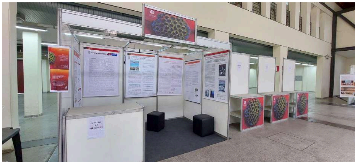
Estande com os banners participantes